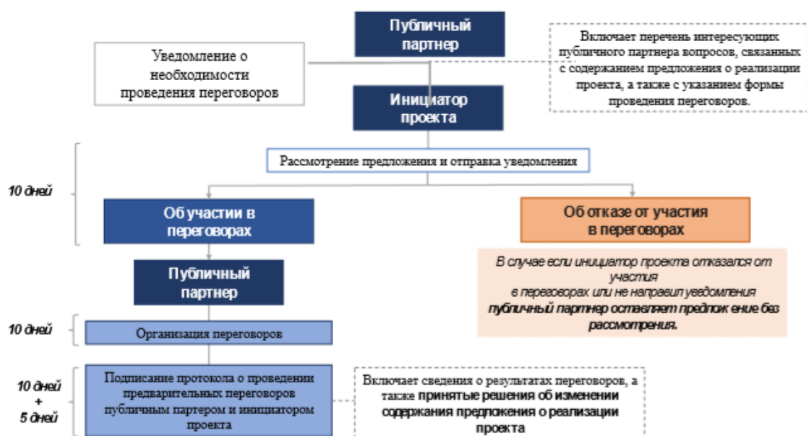
Рисунок 5 – Общая схема проведения переговоров.