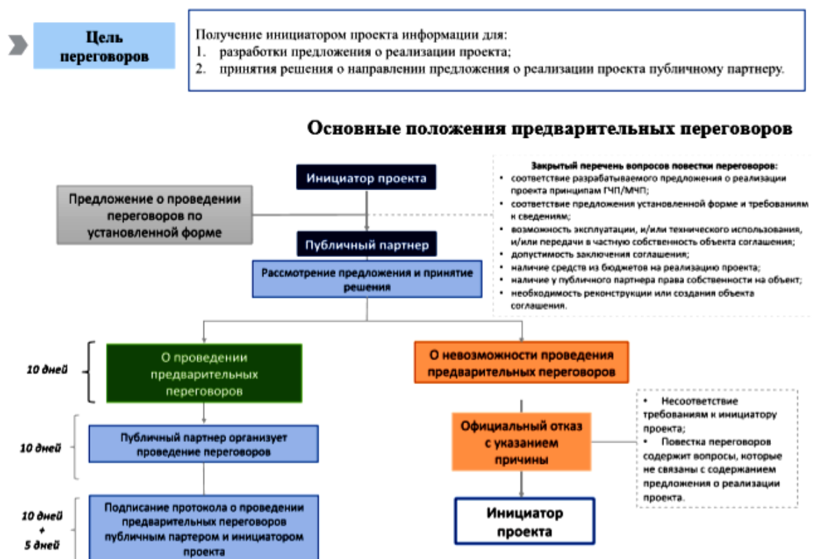
Рисунок 3 – Общая процедура проведения предварительных переговоров.