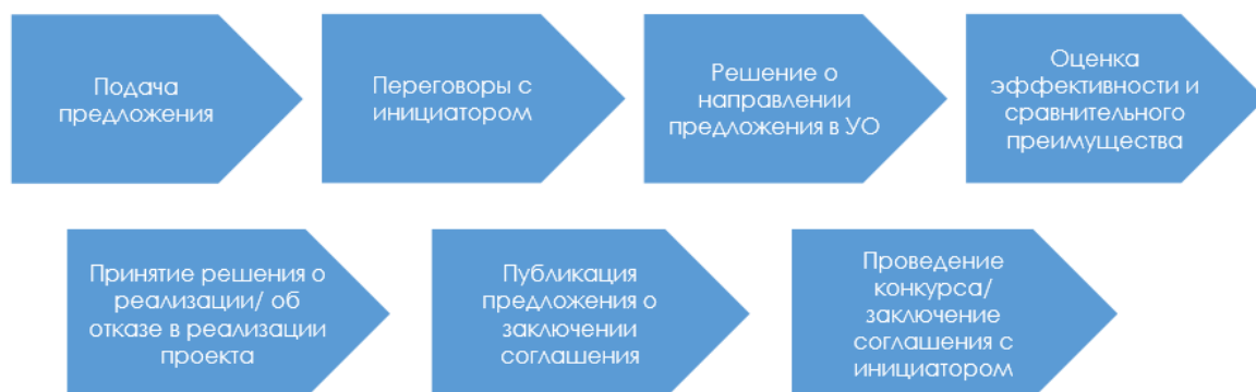
Рисунок 2 – Частная инициатива по Федеральному закону № 224-ФЗ.